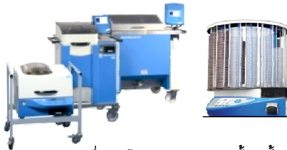
เครื่องเตรียมและเพาะอาหารเลี้ยงเชื้ออัตโนมัติ